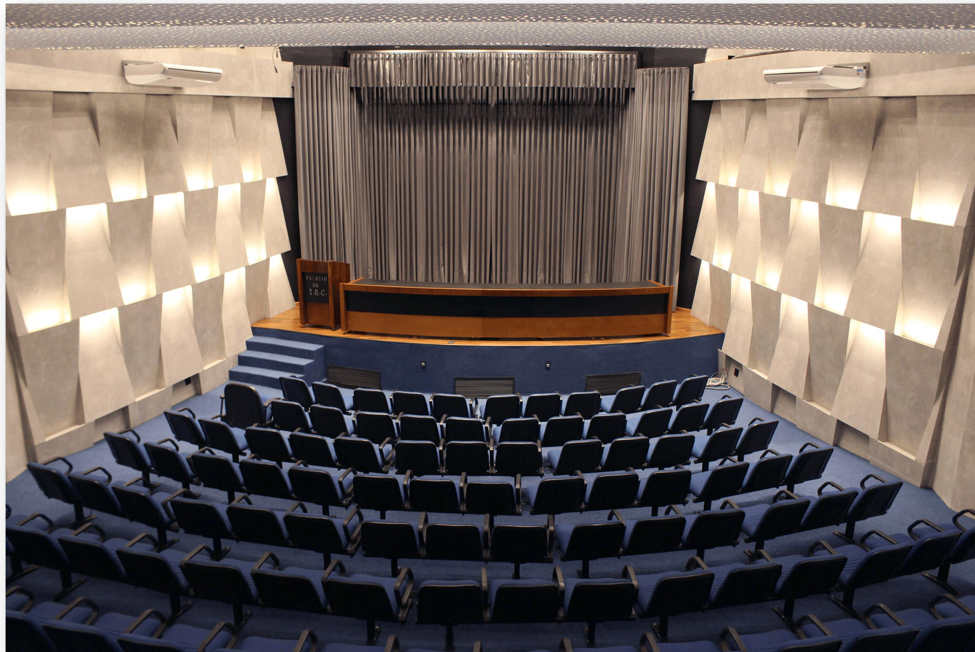
Novo Auditório do Condomínio Sebastião Ubson Carneiro Ribeiro Vista frontal de cima