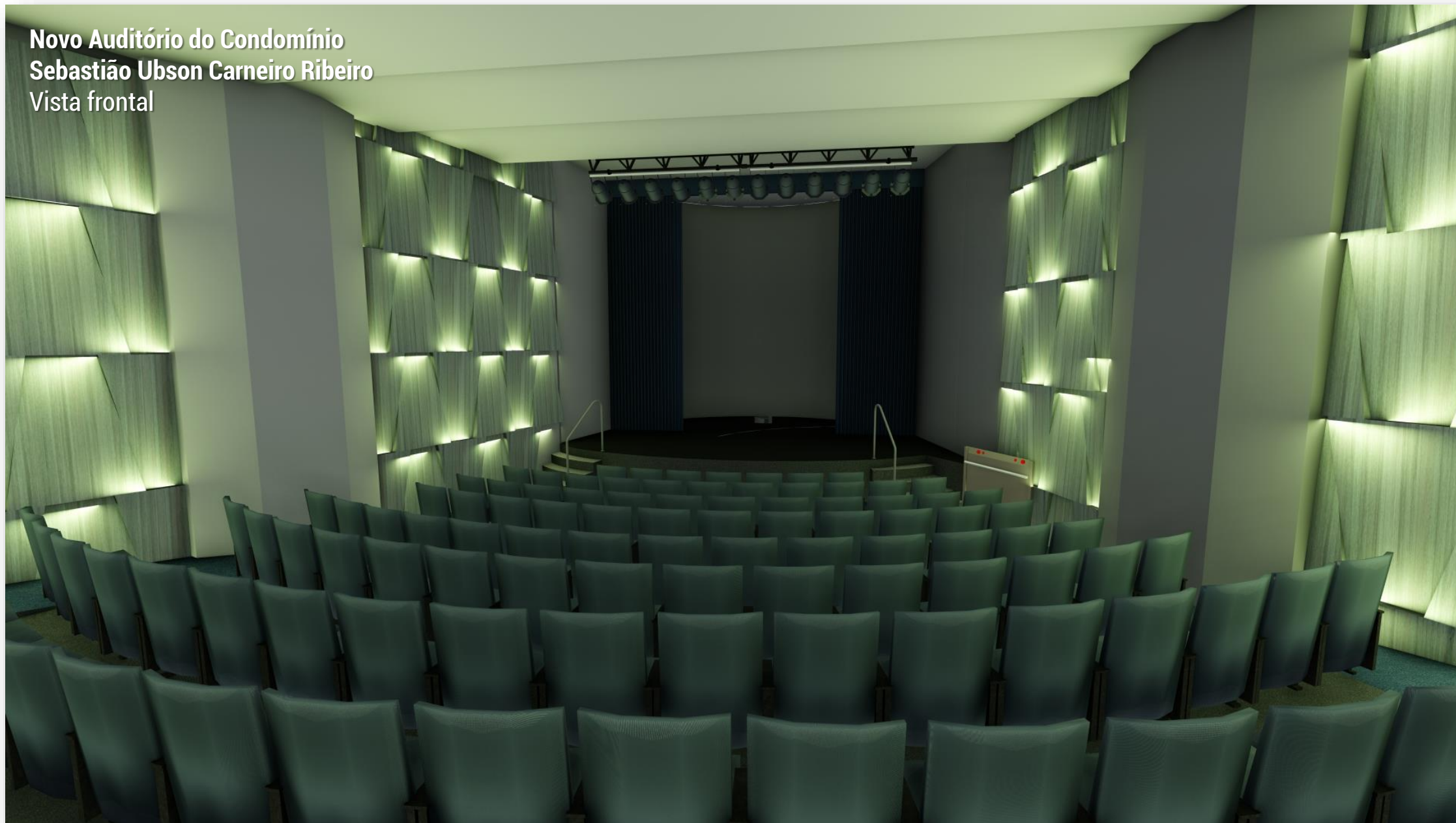
Novo Auditório do Condomínio Sebastião Ubson Carneiro Ribeiro Vista frontal